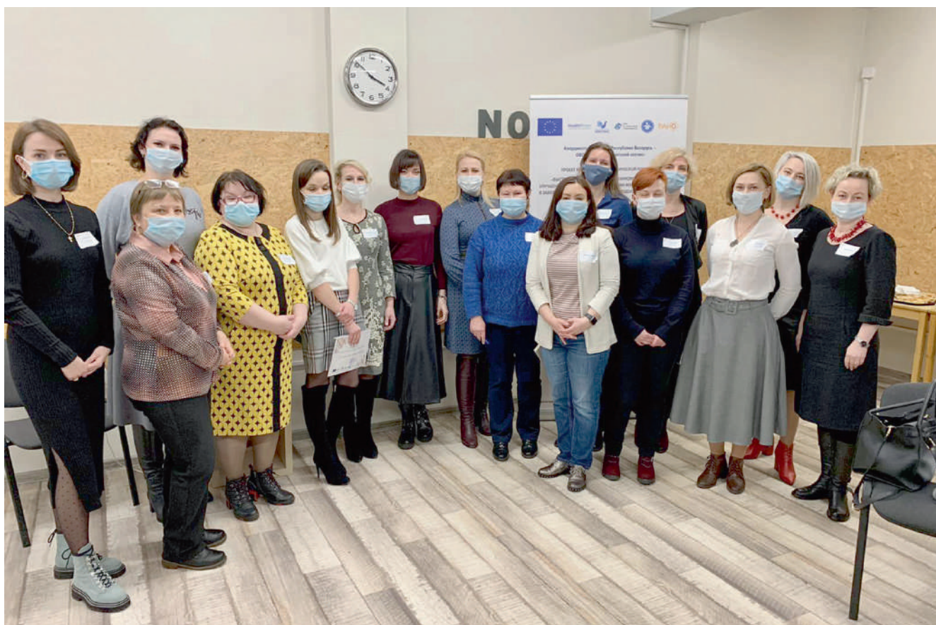
Участники тренинга «Особенности сопровождения уязвимых категорий недоношенных детей» для специалистов ЦРВ (02.03.2021, Минск)

Информирование о родительских пациентских организациях долж-