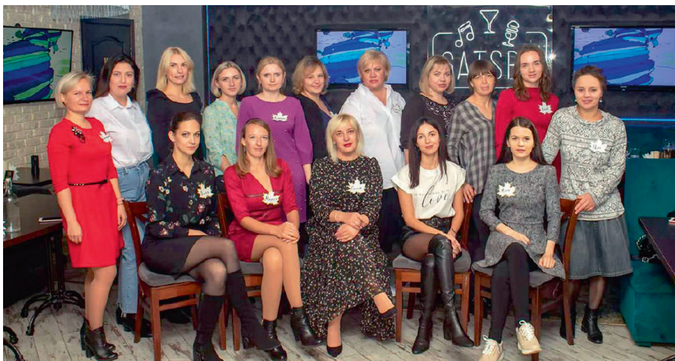
Участники родительского сообщества «Новые горизонты» (14.10.2021, Могилев)

Вопросами о том, как живут их семьи, с какими проблемами сталкиваются, как и чем можно им помочь, на протяжении многих лет занимается Могилевское областное отделение РОО «Белорусский детский фонд» (далее БДФ). В рамках реализации проекта перед Фондом стоя-