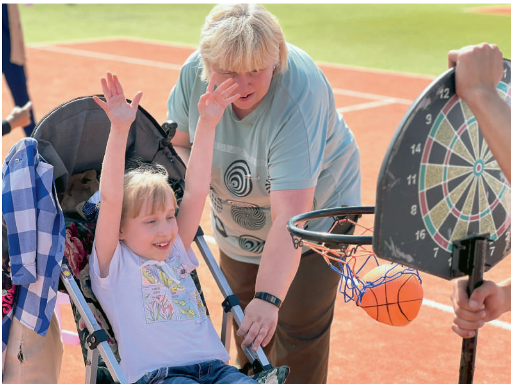
Фрагмент праздника «Веселые старты» (06.09.2023, Могилев)

ха первого праздника помнится до сих пор и придает сил на новые свершения.