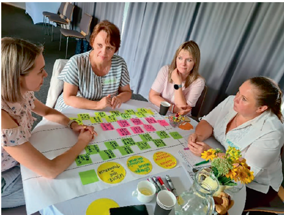
Фрагмент рабочей встречи в формате «Мировое кафе» представителей НКО, которые работают в интересах детей и молодых людей с инвалидностью (18.08.2022, Минск)

компонент проекта, прежде всего потому, что дети, которые были в фокусе их внимания являются воспитанниками домов-интернатов. У более чем половины детей с тяжёлыми и множественными нарушениями развития (ТМНР), проживающих в стационарных социальных учреждениях, опекуном является директор дома-интерната. Без налаживания партнёрских отношений с администрацией этих учреждений не удалось бы реализовать проект. Важно отметить, что на протяжении трёх лет его реализации команде «Есть дело» удалось также выстраивать конструктивное взаимодействие с органами управления социальной сферой, а именно с комитетами по труду, занятости и социальной защите. Эта часть работы является очень важной, ведь благополучие целевой группы напрямую зависит от того, насколько сотрудники домов-интернатов и их руководство будут понимать необходимость изменений в своей рабо-