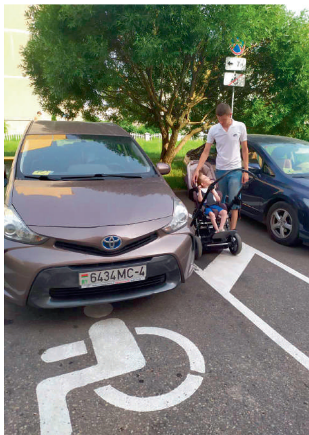
Папа и сын у парковочного места для людей с инвалидностью (июль 2021 года, Гродно)

Решить данную проблему снова помогли письменные обращения, которые помогали составлять наши региональные специалисты совместно с юрисконсультантом проекта. В обращениях указывалась