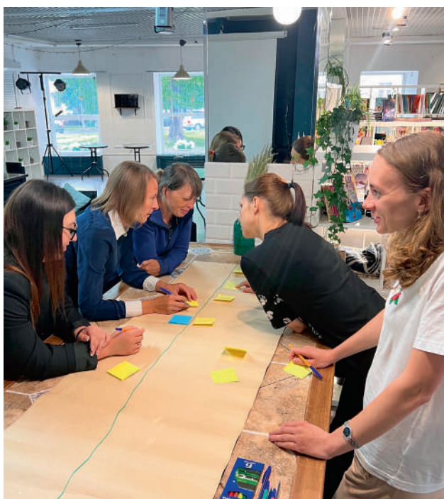
Участники родительского сообщества «Новые горизонты» во время тренинга по стратегическому планированию (28.06.2023, Могилев)