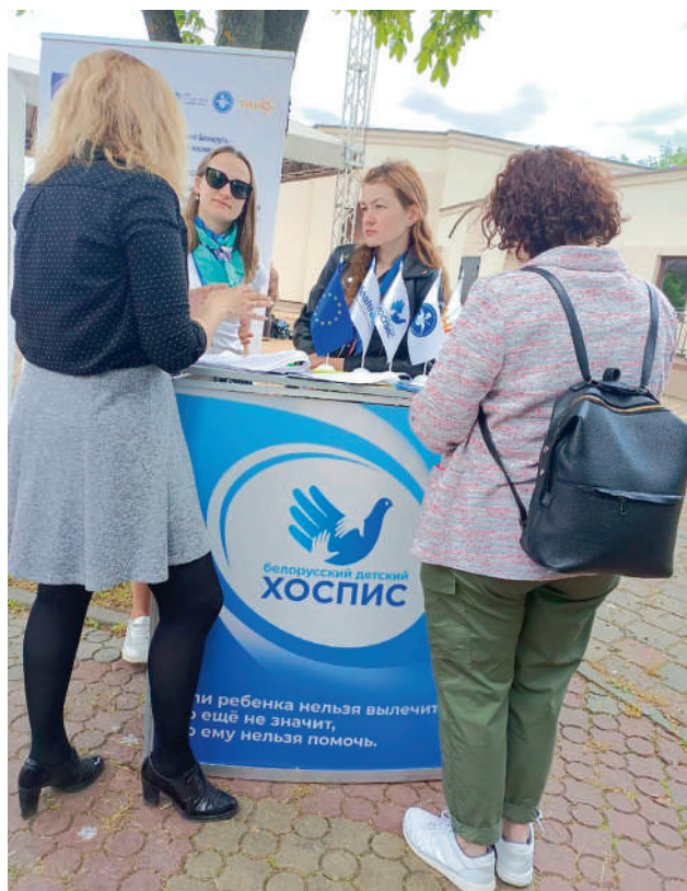
Юрисконсульт проекта и ОБО «БДХ» консультирует родителей, воспитывающих тяжелобольных детей, по правовым вопросам во время мероприятия, приуроченного к Международному дню защиты детей (01.06.2022, Минск)

Семьи, воспитывающие тяжелобольных детей, которые столкну-