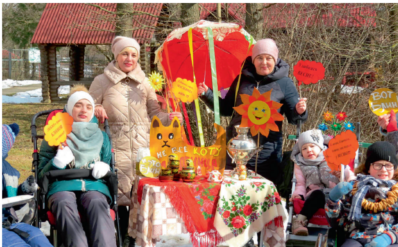
Семьи «Новых горизонтов» на праздновании Масленицы (19.03.2021, Могилев)

Первым самостоятельно организованным мероприятием родительского сообщества стал праздник «Масленица» на территории Могилевского Зоосада. Вся организационную подготовку взяли на себя родители: приглашение артистов, ведущего, фотографа, создание фотозоны и атрибутики праздника, и, конечно, приготовление блинов и всевозможных угощений. Дети и взрослые были в восторге, ведь многие из них впервые посетили подобный праздник. После было организовано множество других мероприятий большего и меньшего масштаба, но радость от успе-