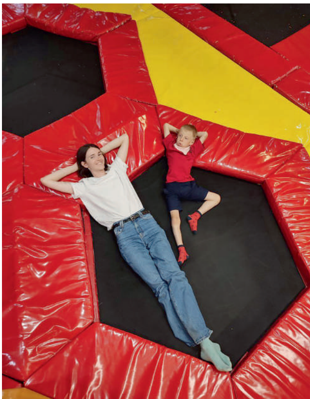
Воспитанник дома-интерната и волонтер во время посещения батутной арены в рамках летнего инклюзивного лагеря (17.08.2021, Минск)

дач и отслеживание результатов. Юридической базой деятельности социально-благотворительного учреждения «Есть Дело» является Конвенция о правах ребёнка , в которой говорится, что каждый ребёнок обладает неотъемлемыми фундаментальными правами.