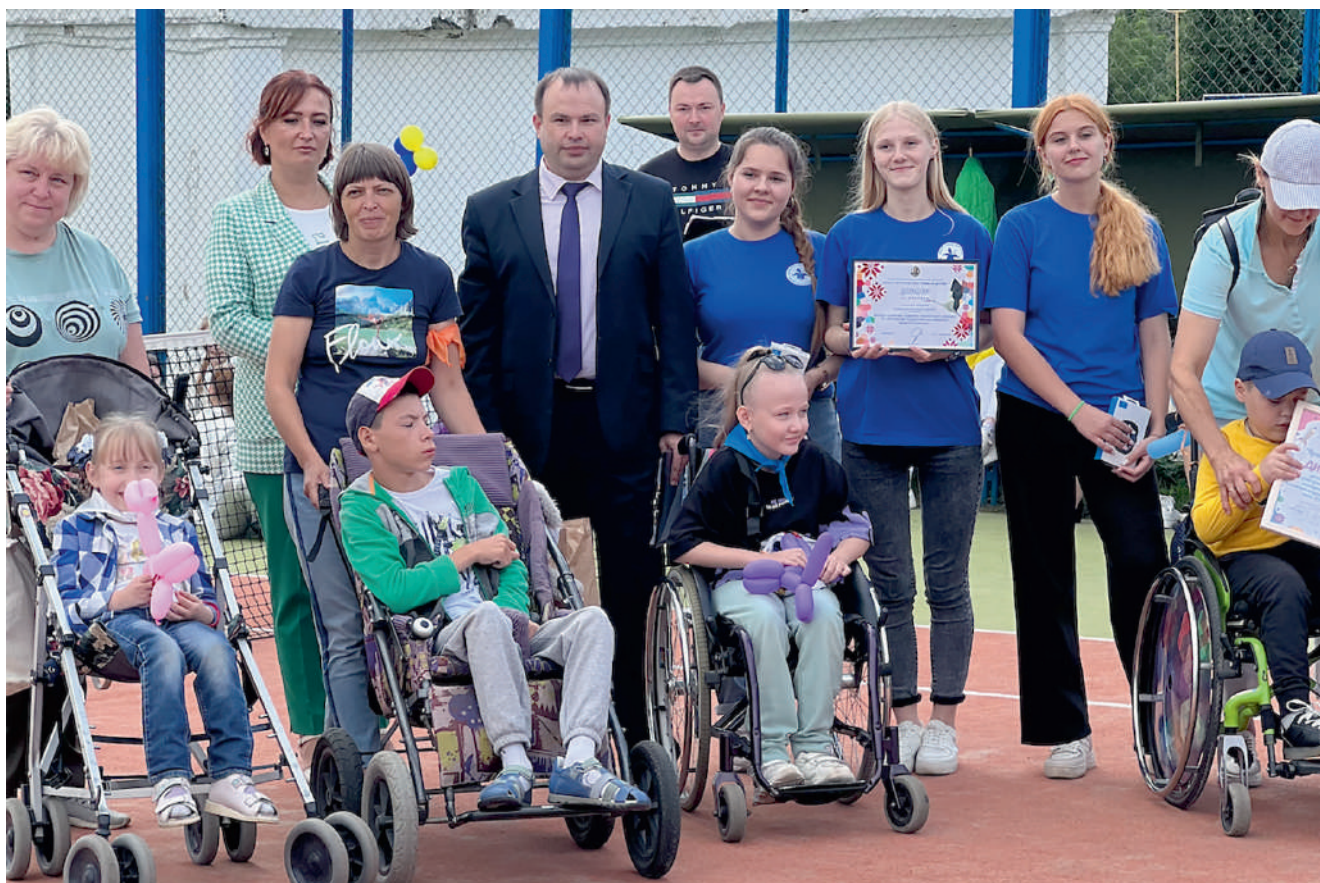
Награждение участников конкурса детских творческих работ «Право на детство» во время благотворительного спортивно-развлекательного семейного праздника «Веселые старты» (06.09.2023, Могилев)

В интересах семей, воспитывающих недоношенных детей, в рамках проекта было налажено тесное сотрудничество РОО «Рано» с Центрами раннего вмешательства (ЦРВ) по всей стране. В проекте было задействовано более 40 специалистов раннего вмешательства из 14 ЦРВ , которые осуществляли домашнее визитирование в семьи, вовлекая всю семью в процесс развития и реабилитации ребенка через рутинные процедуры и ежедневное домашнее взаимодействие с ребенком.