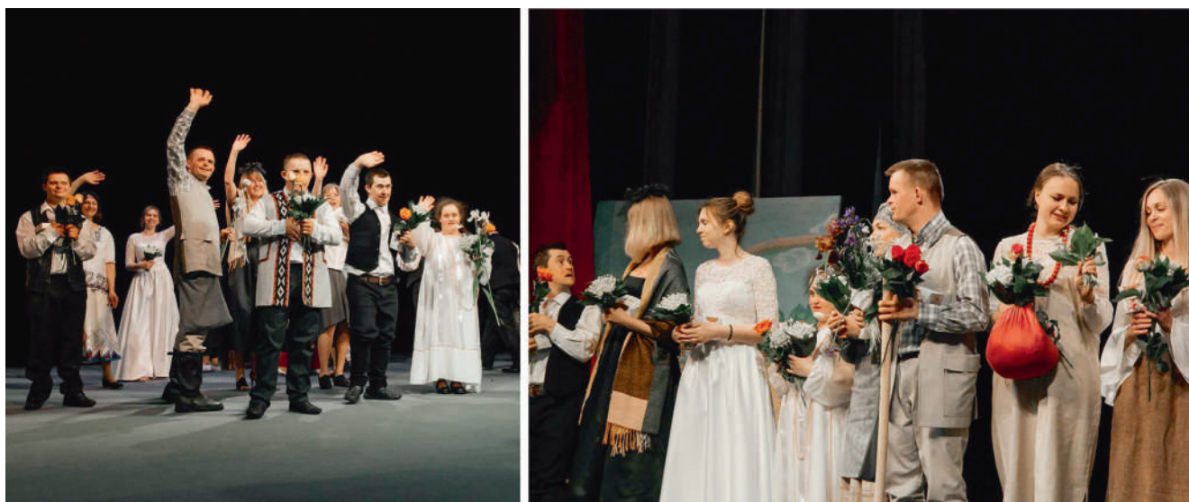
Актеры инклюзивного спектакля «ЖИТЬ...» на сцене Гомельского областного драматического театра (23.03.2022, Гомель)

небольшое представление о детях и взрослых с инвалидностью и об учреждениях, в которых они проживают.