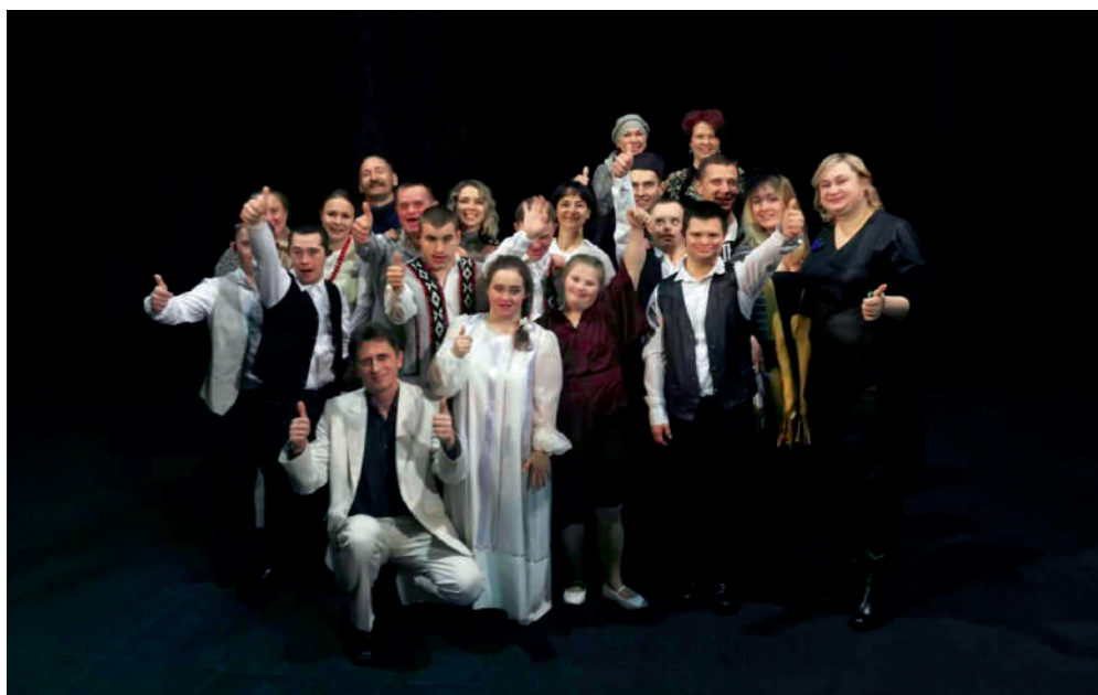
Актерская труппа инклюзивного спектакля «ЖИТЬ...» (Гомель)

это сотрудники дома-интерната для детей-инвалидов с особенностями психофизического развития, а другая часть актерского состава – воспитанники этого интерната. Многие из них имеют тяжелые и множественные нарушения, в том числе, нарушения речи, как, например, у актера, исполняющего главную роль в постановке. Но профессиональные режиссерские решения позволяют всем актерам принимать полноценное участие в пьесе, быть понятыми и услышанными.