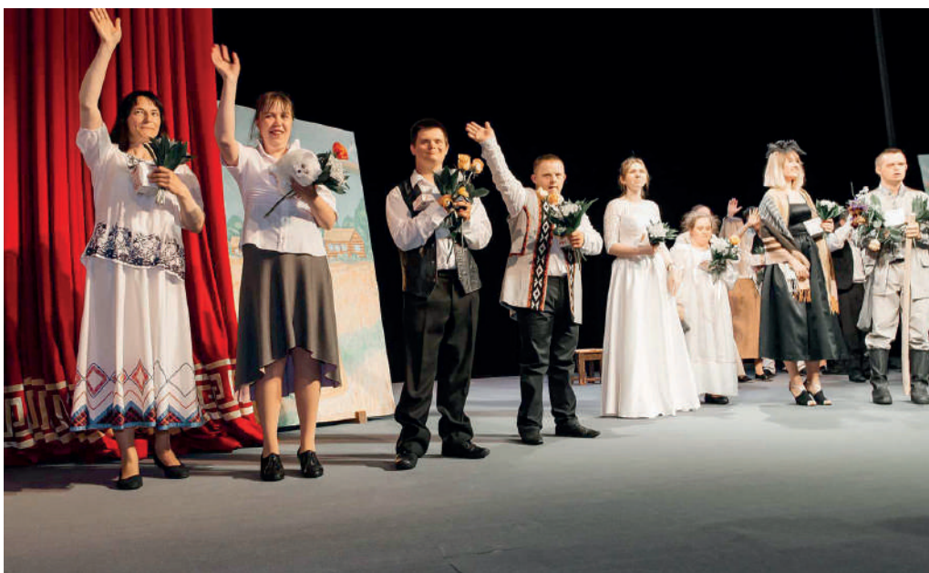
Актёры инклюзивного спектакля «Жить...» (05.12.2022)

Также в рамках PR-кампании «Розныя разам» было проведено несколько партнерских меропри-