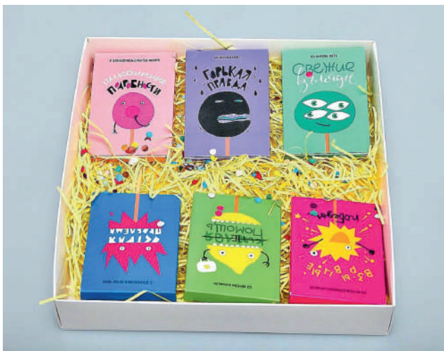
Набор конфет «Факты по вкусу» во время презентации на фестивале рекламы «ЛАМА» (20.10.2022, Минск)

Блогеры с общим количеством подписчиков более 860 тысяч человек разместили яркие истории с использованием полученной информационной продукции. Органический охват их постов и сторис составил более 100 тысяч человек. Проект стал обладателем гран-при фестиваля PR и рекламы «ЛАМА» как лучший информационный продукт, а также многократным призером международного конкурса рекламы «Белый квадрат».