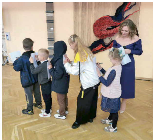
Во время мастер-класса по изготовлению мягких игрушек во время проведения фестиваля «Щучынськія шарлоткі» (24.09.2022, Щучин)

Но основной упор снова сделали на лидеров мнений и профессиональные «паблики». В первую очередь, мы нашли городской «паблик» о событиях и новостях Щучина в инстаграм, с широкой аудиторией подписчиков. «Паблик» с удовольствием разместил анонс о нашем мероприятии и афишу. Также мы обратились к местным кондитерам, так как тема шарлоток для них близка. Одна из ведущих кондитеров Щучина стала в итоге членом жюри конкурса и предоставила свои изделия в качестве призов участникам. Нас поддержали местные мастера в сфере красоты, флористы, владельцы кофеен и ресторанов. Благодаря размещению информации в их социальных сетях