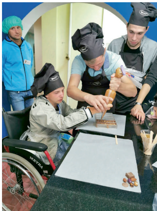
Во время мастер-класса по кулинарии в доме-интернате (11.11.2022, Гомель)

Частые инфекции дыхательных путей сотрудники домов-интернатов связывали с неблагоприятными погодными условиями и отсутствием иммунитета у воспитанников, но не с последствиями неправильного ухода. Полученные знания на обучающих мероприятиях способствовали тому, что в некоторых учреждениях выходы воспитанников на улицу стали регулярными не только в летний период, но и в осенне-зимний, что раньше невозможно было даже представить (у многих детей не было зимней верхней одежды и обуви). На улицах появились беседки, навесы, батуты, специальные качели для детей, передвигающихся на колясках.