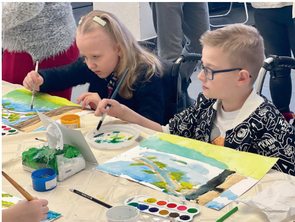
Мастер-класс по созданию пейзажа акварельными красками для детей (19.03.2021, Могилев)

В рамках сообщества у участников появилась возможность реализовать свой творческий потенциал. У многих мам «золотые руки». Они раскрыли свои таланты и показали мастерство в изделиях ручной работы. Мамы не только делают своими руками подарки для ребят, но и проводят авторские мастер-классы для детей и взрослых по созданию handmade-изделий, декупажу, рисованию, росписи пряников. Раз в год силами этих мам «Новые горизонты» организуют ярмарку, на которой все желающие могут приобрести понравившиеся изделия и тем самым поддержать родительскую инициативу. На вырученные средства участники сообщества приобретают материалы для детских мастер-классов и праздников.