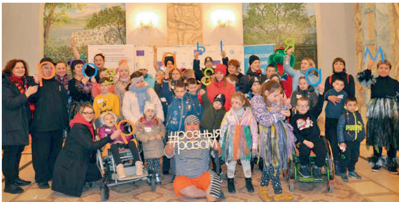
Участники фестиваля «Розныя разам» (05.03.2022, Круглое)

мам тяжелобольных детей в Беларуси, реализации права ребенка с инвалидностью полноправно участвовать в жизни общества. Были разработаны логотип PR-кампании, хештеги, ряд информационных материалов и промо-продукция, которые были распространены среди целевой группы проекта.