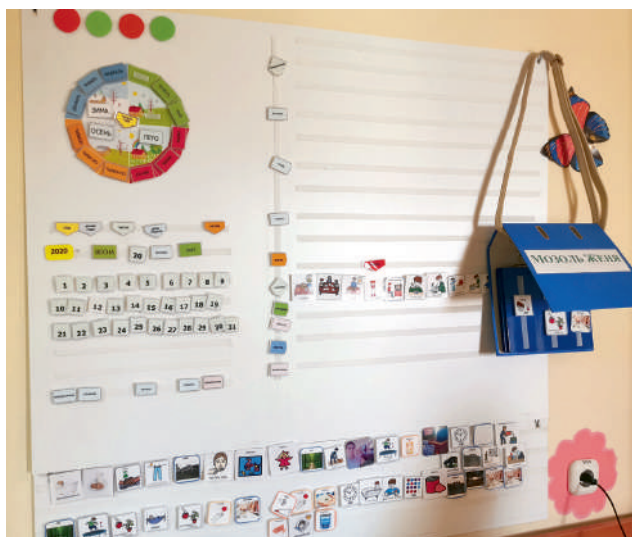
Пример визуального расписания для ребенка с расстройствами аутистического спектра (РАС)

увидеть таких детей рядом с собой, убедиться, что они не страшные и не опасные.