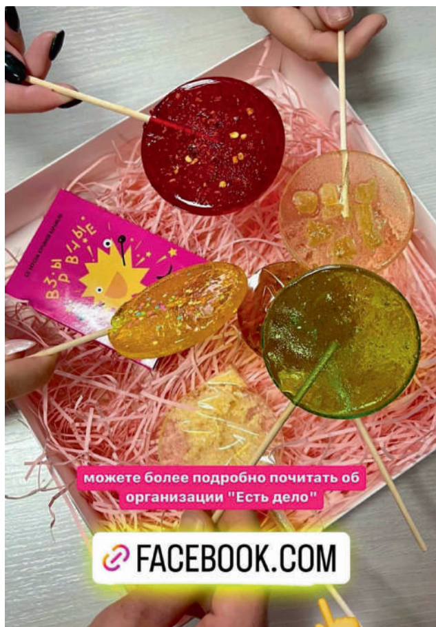
Скрин публикации в «сторис» об акции «Факты по вкусу» на странице Obzoor.by в инстаграм. Минск (28.09.2022, Минск)

воспитанники домов-интернатов с помощью волонтеров или инструкторов по труду могут делать своими руками, а также это еще один способ заявить о своих возможностях.