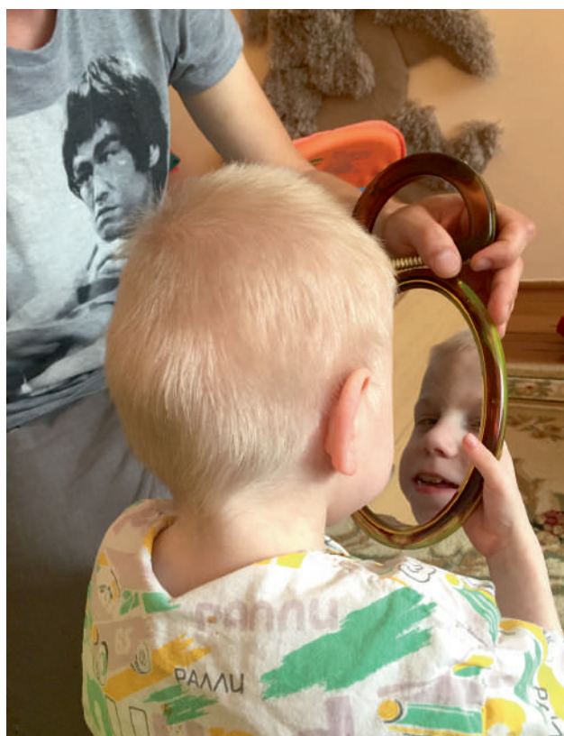
Во время занятий с волонтерами воспитанник дома-интерната смотрит на свое отражение в зеркале (июль 2022, Минск)

Очень важным показателем изменения отношения к детям с тяжёлыми формами инвалидности в учреждениях, а также показателем улучшения качества их жизни является то, что многие воспитанники, ранее проводившие дни и ночи в своих кроватях, глядя в потолок, получили возможность для смены обстановки (ст. 19 Конвенции). Их жизненное пространство стало более разнообразным. В отделениях появились различные технические средства реабилитации и материалы, позволяющие ребенку сменить позу (вертикализаторы, коляски, стульчики, ходунки, подушки и валики для укладки и позиционирования), что дало возможность детям играть на полу, сидеть на стуле, передвигаться в коляске. Со-