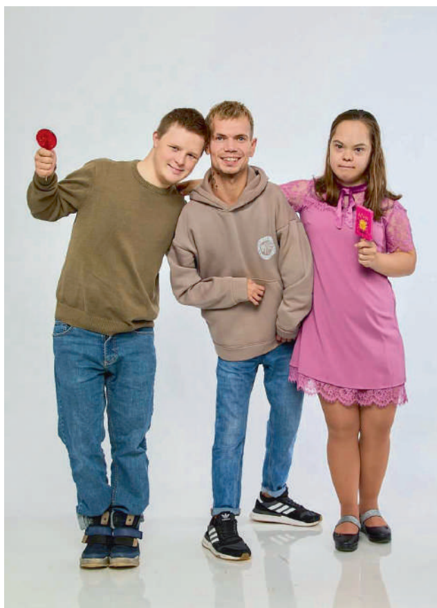
Участники фотосессии для презентации акции «Факты по вкусу» на фестивале рекламы «ЛАМА» (04.10.2022, Минск)

различных номинациях (Гран-при фестиваля рекламы «ЛАМА», золото Международного фестиваля «Черный квадрат», серебро и бронза Международного фестиваля «Red apple»). По итогам успешного сотрудничества рекламный холдинг «TDI group» запустила социальное направление по разработке креативных информационных кампаний для социальных проектов.