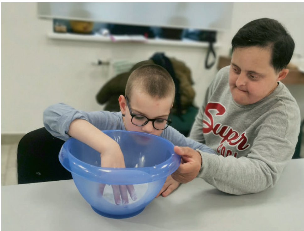
Во время мастер-класса по кулинарии в доме-интернате (11.11.2022, Гомель)

лого», а также структура учреждений системы социальной защиты, предполагающая, что директор учреждения (поставщик социальной услуги) является и опекуном ребенка, оставшегося без попечения родителей (заказчиком социальной услуги). Кроме того, даже при относительно небольшой наполняемости домов-интернатов (на начало 2021 года – 1396 проживающих в 9 учреждениях, из них 562 ребенка) они не приспособлены для того, чтобы обеспечить индивидуальный подход к реабилитации, социализации и развитию детей, особенно если речь идет о детях с ТМНР, потребности которых в уходе и развитии могут быть значительно выше, чем у нормотипичных сверстников.