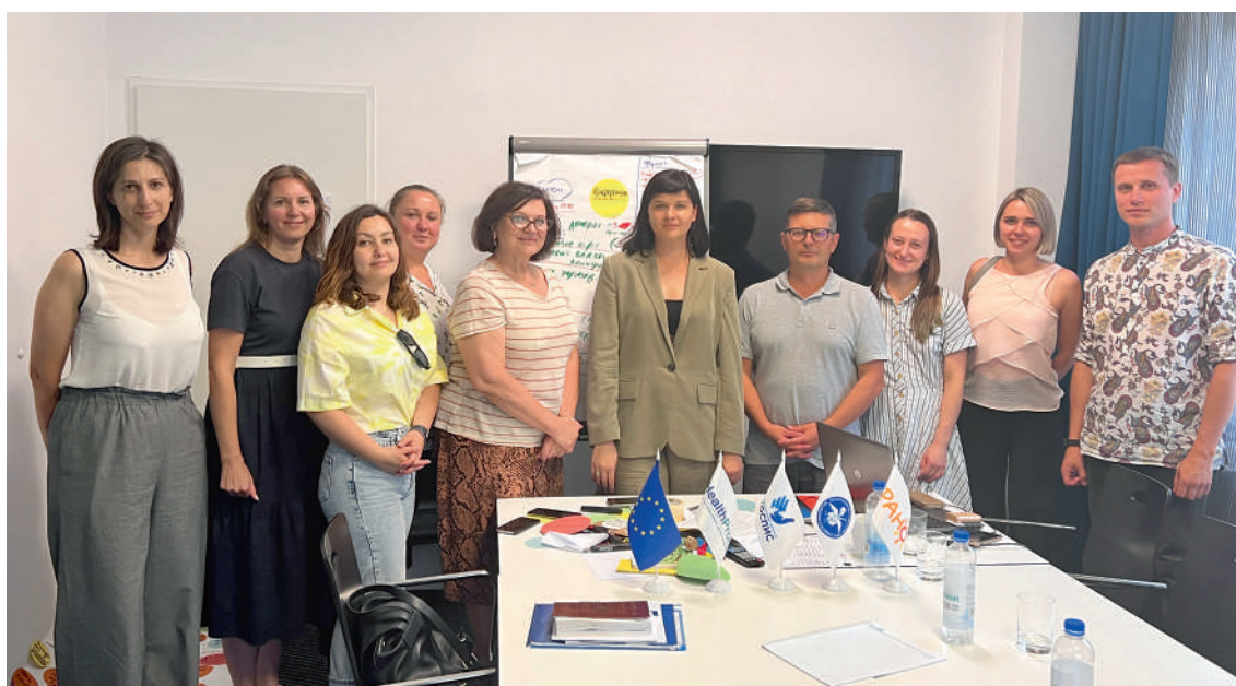
Представители организаций-партнеров планируют завершающий этап реализации проекта (30.08.2023, Минск)

Деятельность в рамках проекта расширяет доступную поддержку семьям тяжелобольных детей через защиту их прав и содействие обеспечению причитающихся льгот и выплат, а также даёт возможность отдельным родителям, организациям, возглавляемым родителями, и другим социальным некоммерческим организациям самостоятельно осуществлять деятельность по защите интересов данной группы и усовершенствовать их способность эффективно защищать права таких детей.