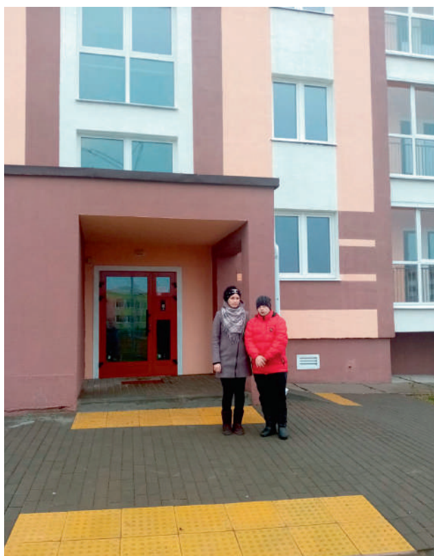
Мама и сын, получившие социальное жилье (ноябрь 2021 года, г. Славгород, Могилевская обл.)

При таком исходе событий многие семьи уже практически потеряли надежду построить свое жилье