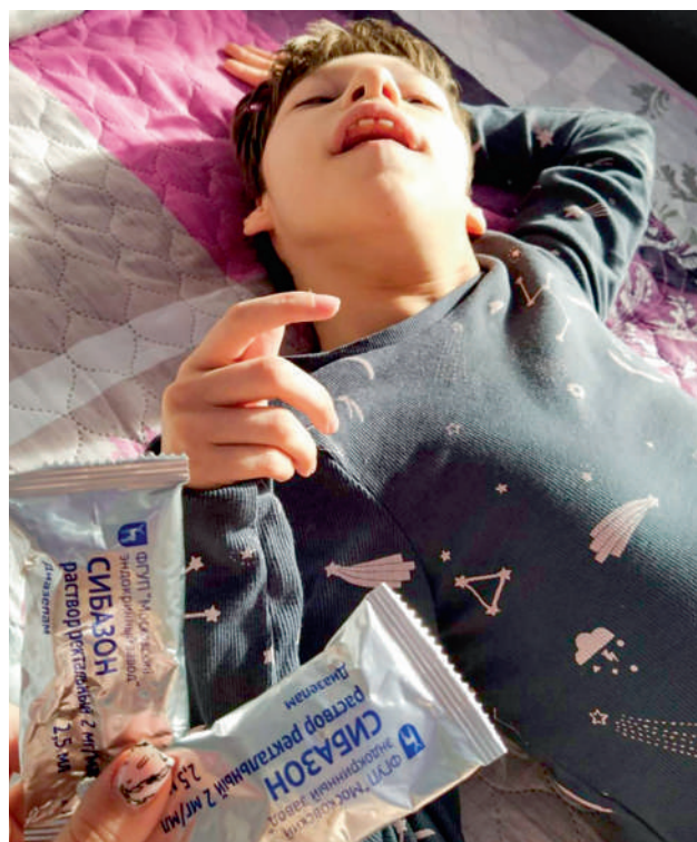
Ребёнок, одним из первых получивший препарат Сибазон (29.09.2022, Гомельская область)

Одним из ярких случаев успешного адвокатирования с использованием инструмента составления коллективного обращения, стала работа над совершенствованием белорус-