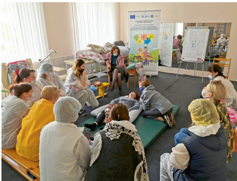
Сотрудники дома-интерната во время тренинга по правильному позиционированию и безопасному перемещению (15.05.2021, Городище)

Также были разработаны и проведены обучающие мероприятия для сотрудников домов-интернатов, направленные на повышение компетенций, от которых напрямую зависит качество жизни детей с ТМНР: особенности позиционирования, кормления, ухода, основы альтернативной коммуникации, особенности построения коммуникации с детьми с аутизмом и поведенческими нарушениями, повышение уровня командного взаимодействия сотрудников и профилактика их профессионального выгорания.