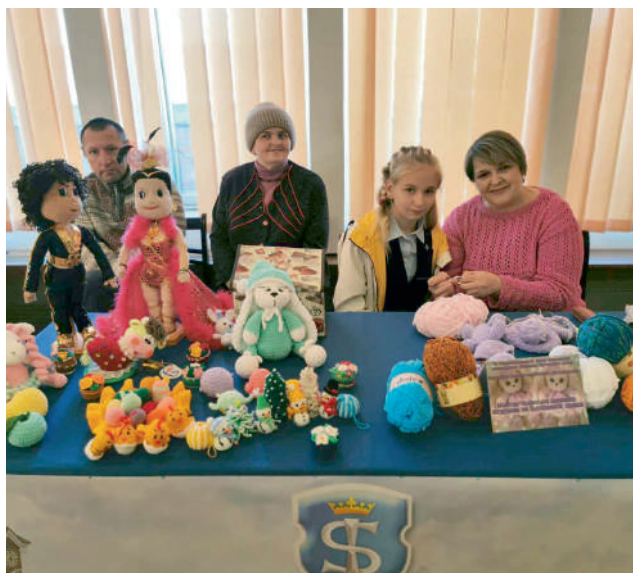
Гости фестиваля «Щучынськія шарлоткі» во время проведения мероприятия (24.09.2022, Щучин)

ит уделить приглашению гостей и участников конкурса. Для информирования местных жителей организаторы использовали районные печатные издания и их интернет-версии.