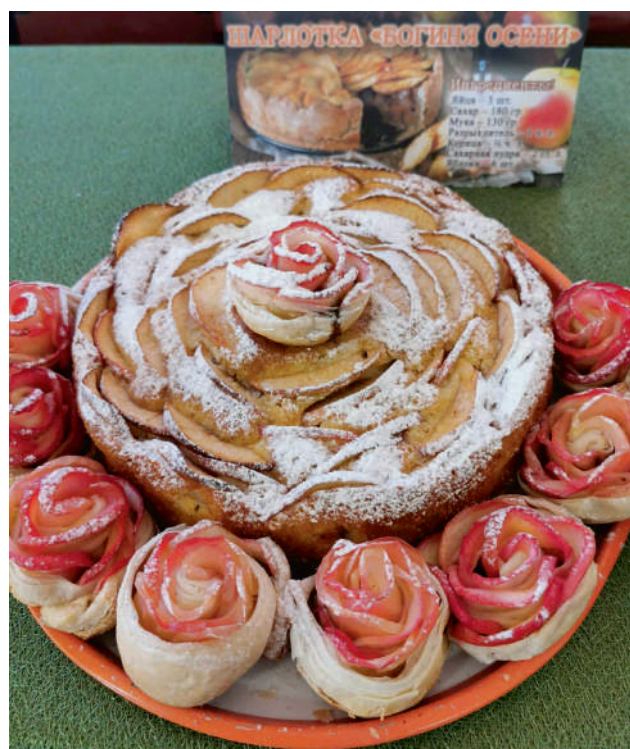
Шарлотки, представленные на конкурс во время проведения фестиваля «Щучынскія шарлоткі» (24.09.2022, Щучин)

гран-при конкурса в номинации «Самы смак». Были разработаны критерии оценки конкурсантов, которые размещались в открытом доступе, как и положение о фестивале в целом. Для жюри были разработаны оценочные листы и протоколы подсчета баллов. После конкурса все шарлотки предлагалось продегустировать гостям фестиваля.