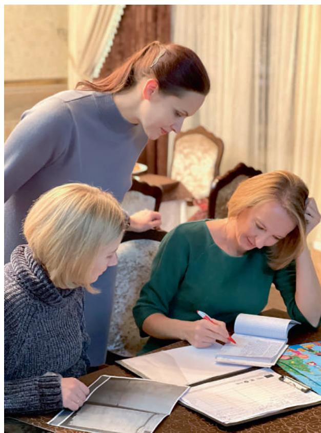
Обсуждение планов сообщества «Новые горизонты» на рабочей родительской встрече (19.12.2022, Могилев)

Понимая, что организационная деятельность сообщества требует информационной поддержки и дополнительных навыков, родители стали искать способы получения новых знаний. Они участвовали в тренингах и семинарах по компьютерной грамотности, искусству коммуникации и публичным выступлениям, стратегическому планированию, техникам работы со стрессом и волнением. Полученные знания были важны не только для роста сообщества, но и для каждого участника лично. Кроме этого,